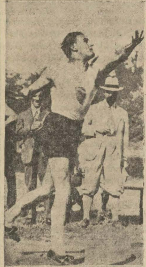
Daranyi gülle atıyor metreye atan Amerikalı Foktadır.

Bu yeni rekorun resmîyet kesbedip etmeyeceği malûm değildir. Tek kolla gülle rekoru halâ (928) olimpiyadında Amsterdama gülleyi (15,87)